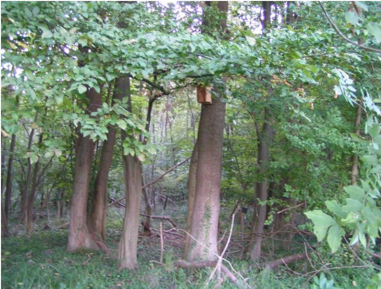
D7: neu an Eiche etwa Mitte Ostrand in 2. Reihe; gutes Moosnest mit Haaren, Blaumeise