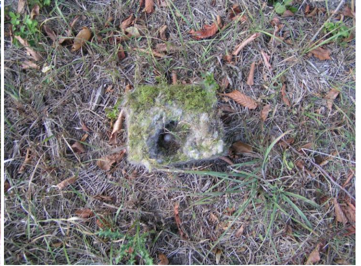
D4: neu; an Buche ca. 15 m rechts von Ecke; gutes Moosnest ca. 3 cm