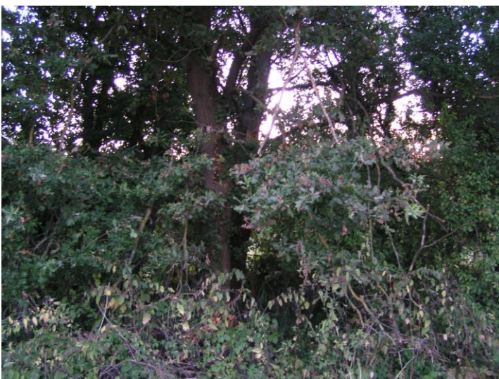
D9: neu an Eiche 50 m nördlich von Quergraben Gommersheimer Feld; großes Moosnest mit Feinmaterial 6 cm, Blaumeise