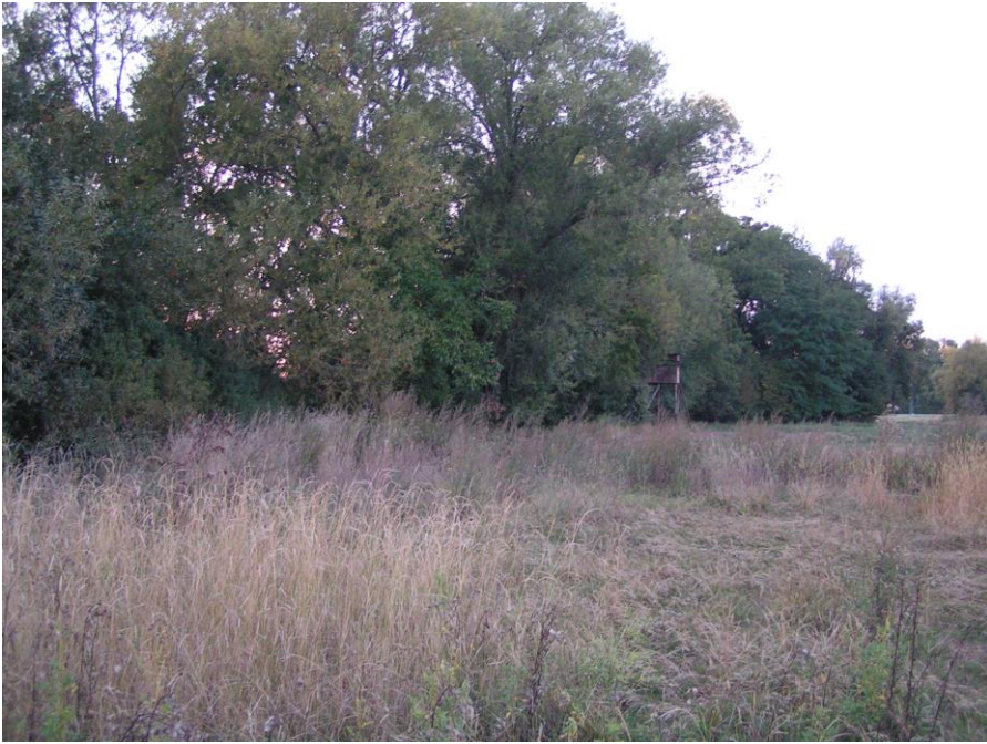
D10: neu an Eiche am schmalen Durchgang über Graben; 50 m südlich von Hochsitz; gutes Nest 3 cm; Blaumeise