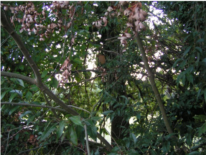
D 11: neu weit weg von Vegetationsrand ca. 35 m nördlich von Hochsitz; Brutkasten leer