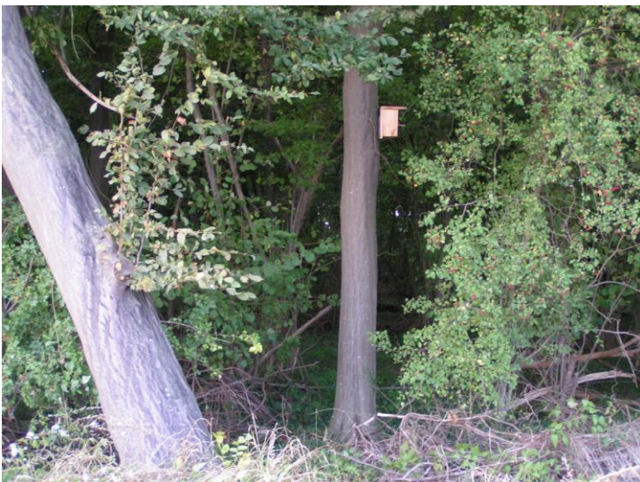
D2: neu; sehr schön ausgebildetes Nest (10 cm hoch) mit kleiner Kuhle an Buche; 2 Eier, Blaumeise