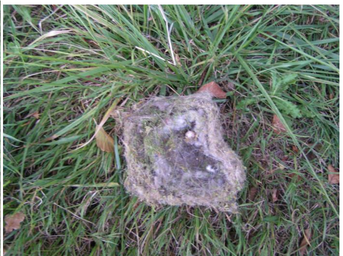
D6: neu; Ostrand 20 m links von altem Hochsitz etwas versteckt in 2. Reihe; gutes Moosnest mit feiner Polsterung Blaumeise mit einem Ei