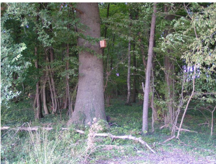
D3: neu; an Eiche ca. 20 m links von Ecke; gutes Moosnest mit Federn; Blaumeise?