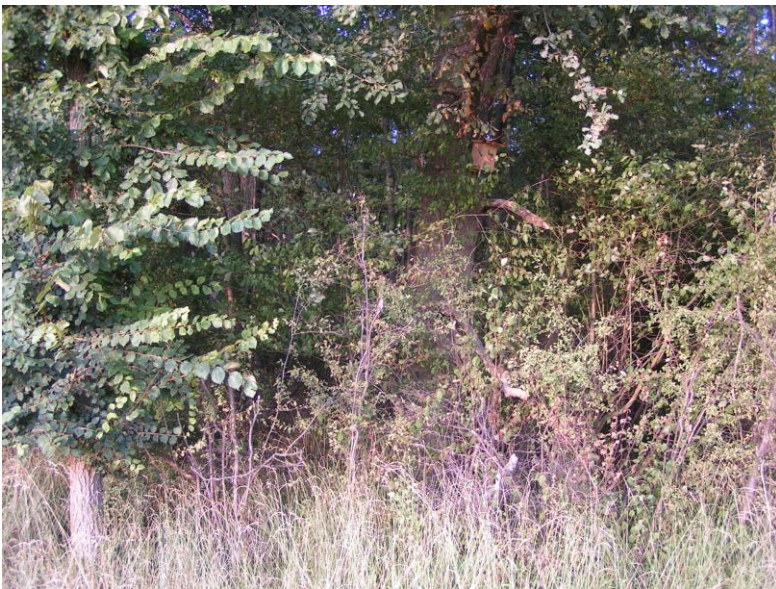
D5: neu; an dicker Eiche Mitte Westrand mit gutem Moosnest ca. 5 cm