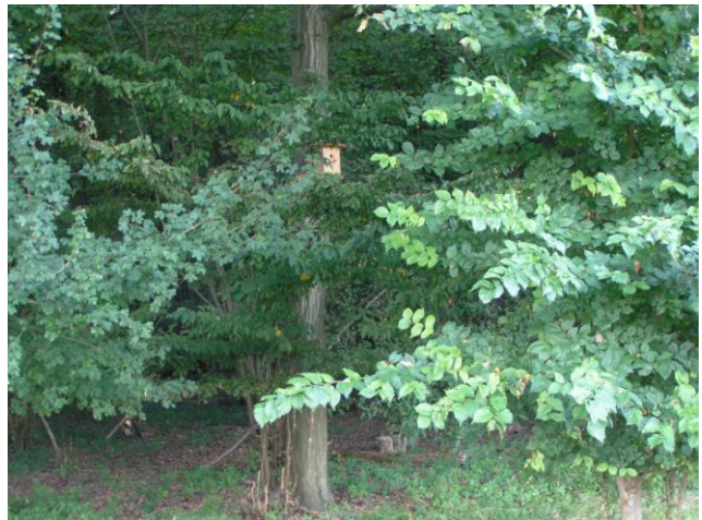
D8: neu an Buche 50 m links von neuem Hochsitz, 10 m rechts von großer Eiche; gutes Moosnest mit Polsterung; Blaumeise